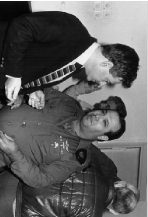
Эрчим Сне с генералом Мейром Даганом, нынешним главой МОСАДа. 1988 г.