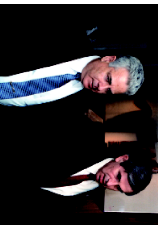
Министр транспорта Сне с заместителем министра обороны США (ныне — председателем Всемирного банка реконструкции и развития) Вольфовичем. 2002 г.