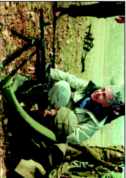
Заместитель министра обороны с бойцами ЦАХАЛ. 2000 г.