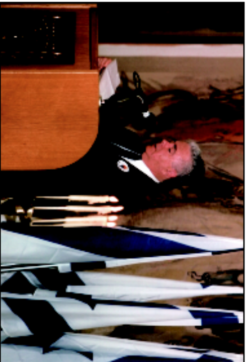
День памяти жертв катастрофы в Кнессете. Чтение списка погибших.