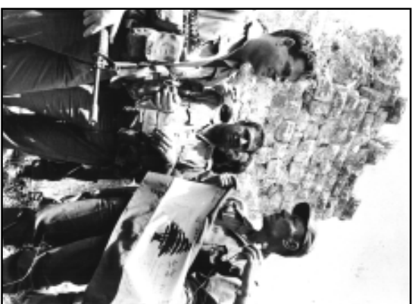
Полковник Сне, командующий Зонай безопасности в Южном Ливане, и командир ЦАХАЛ Саяд Хадад в освобожденной крепости Вафор. Июнь, 1982 г.