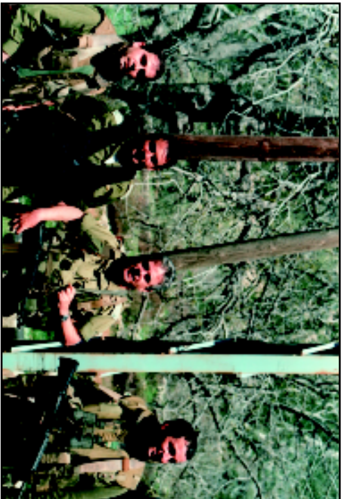
Пятидесятитрёхлетний генерал записал — доброволец в Южном Ливане. Стоящий слева человек обнаружил во время патрулирования необычный камень. Это оказалась бомба (50 кг тротила). Иначе не было бы ни фотографии, ни книги... 1997 г.