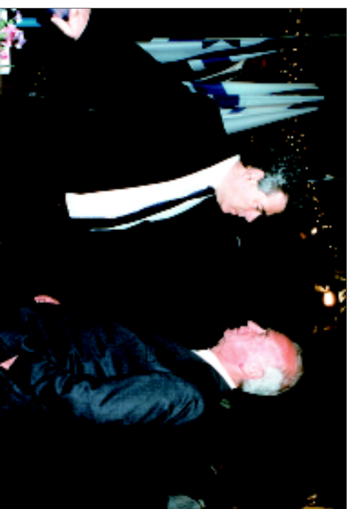
С Ицхаком Рабинным за месяц до убийства.