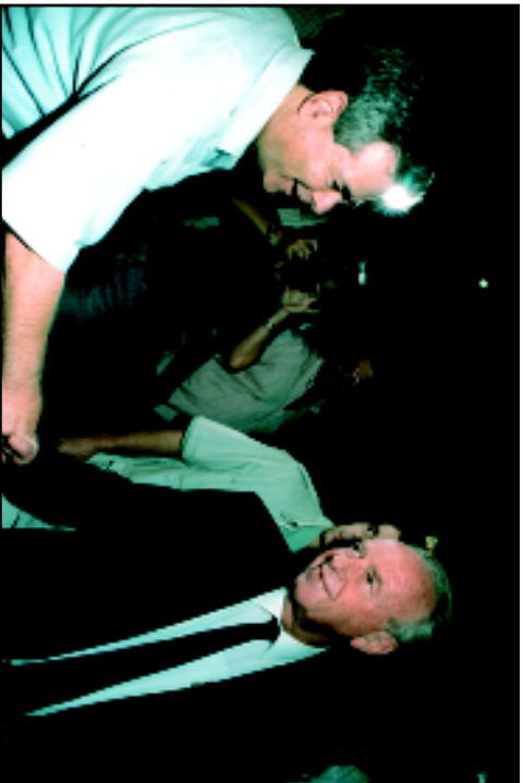
Ицхак Рабин поздравляет Сне с назначением на должность министра здравоохранения. 1994 г.