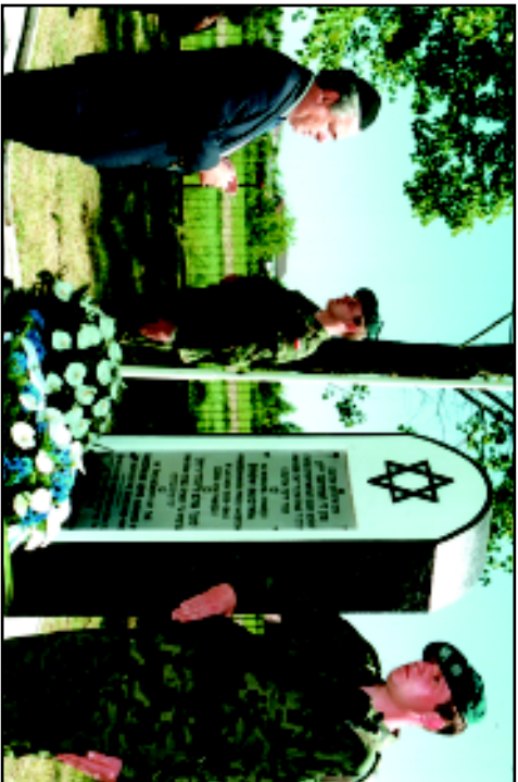
У паметника погинулим еврејм в месечке Радзин, Польша (родина отца Сне). 2005 г.