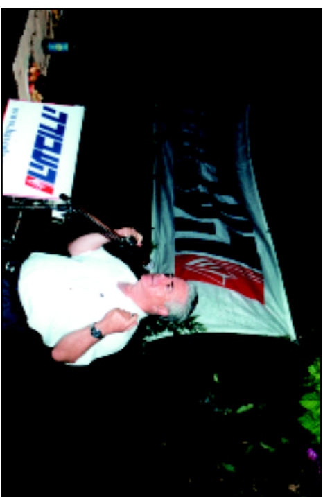
Митинг партия Авода. 2004 г.